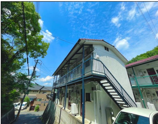
【外観写真】※物件南側から撮影