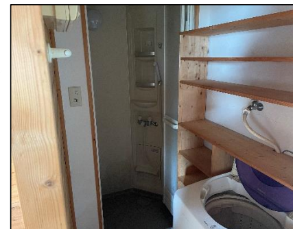
【シャワースペース】