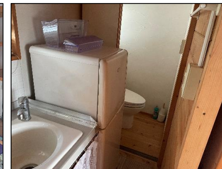
【トイレ・備付冷蔵庫】