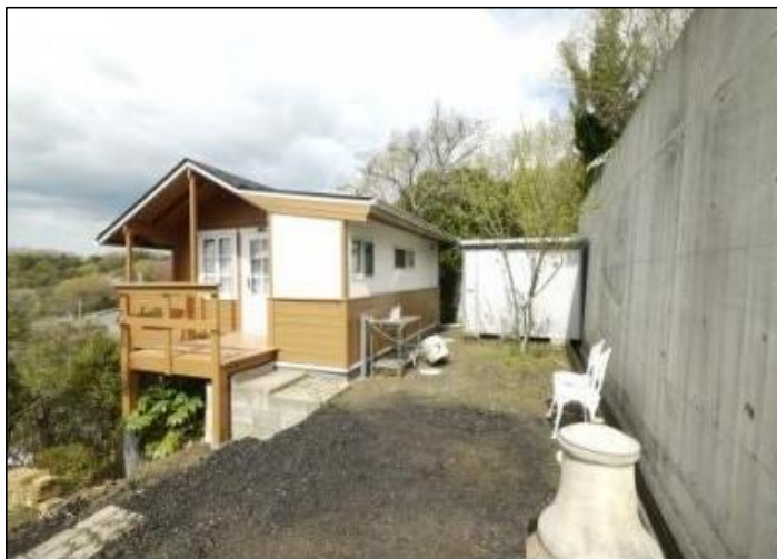
【外観写真】※物件北東側から撮影