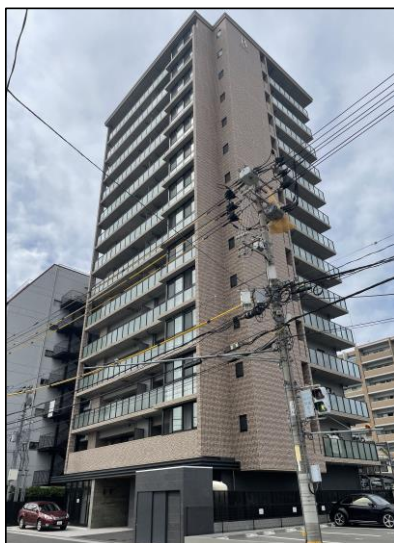
【外観写真】 【エントランス】 2022年8月16日撮影