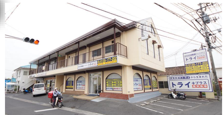
【外観写真】※物件北東側から撮影